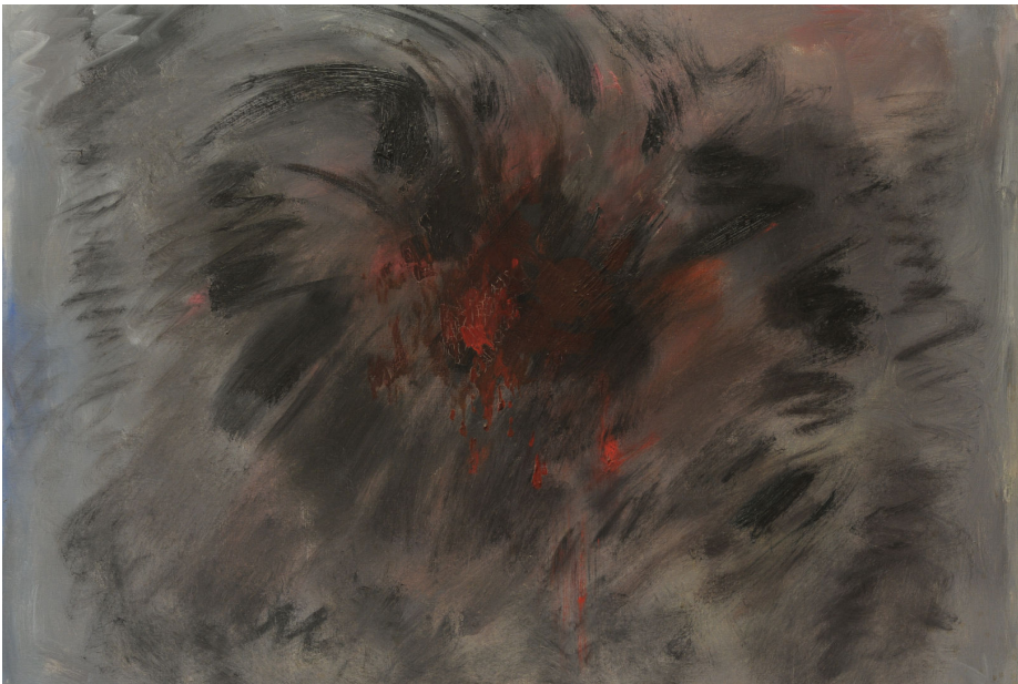
Fig. 7 - Federico SPOLTORE, Trauma Linciaggio , 3 di 3, 1965, Olio su tela, 80 x 100 cm. Chieti

Scelto un fatto e colta l'emozione interiore ad esso associata, si può rappresentare quest'ultima sia in modo figurativo (con riferimento esplicito, ma sommario al fatto), sia non figurativo. Ciò è possibile attraverso un passaggio intermedio, in cui si identifica un nucleo simbolico su cui si concentra l'emozione. Le tre figurazioni della serie didattica Trauma/ Linciaggio sono diverse, pur mantenendo la medesima intenzione e intensità comunicativa, e lo stesso contenuto. Sono le forme a cambiare, non i contenuti. E forse, l'intensità diviene anche maggiore.