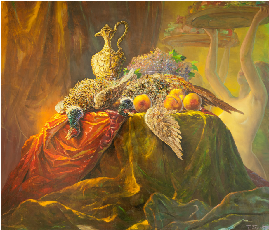
Fig. 4 - Federico SPOLTORE, Opulenza , 1954, Olio su tela, 130 x 150 cm. Chieti

Su superfici di velluti colorati, nature morte, cacciagione e nudi femminili morbidamente distesi, con «una sensualità che va oltre il dato descrittivo e diventa metafora di una concezione della vita» 22 , gli elementi si assommano gradualmente: velluti e sete, pesche, fagiani, figure di donne, combinandosi diversamente fino alla sintesi rappresentata da Opulenza (1954, fig. 4).