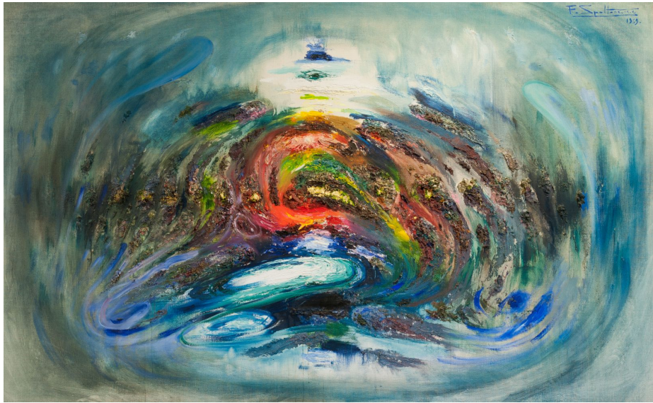
Fig. 9 - Federico SPOLTRE, Momento di Genesi n° 2 , 1969, Olio su tela, 110 x 175 cm. Chieti, cortesia UBI Banca, ©Collezione UBI Banca

cosmica della realtà, ha in sé stessa il principio di tutti i possibili fenomeni emotivi», spiega l'artista 39 (peraltro l'idea della materia che nasce, che si fa, risulta di immediata comprensione, si veda Momento di Genesi n. 2, fig. 9); il “Ciclo della musica”, in cui Spoltore indaga le sonorità di Ciajkovski, Beethoven, Chopin o Ravi Shankar; il “Ciclo delle visioni cosmiche”, dal cromatismo acceso, vibrante, ricco, trascendente.