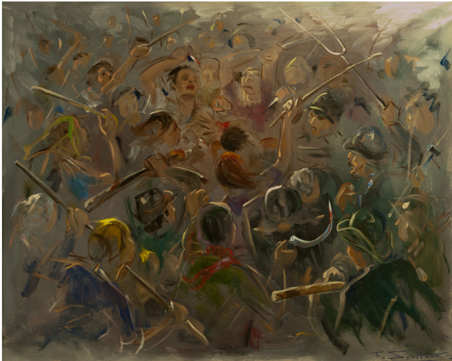
Fig. 5 - Federico SPOLTORE, Trauma Linciaggio , 1 di 3, 1965, Olio su tela, 80 x 100 cm. Chieti

Del resto, lo stesso artista per spiegarla ricorre a serie didattiche di tre dipinti, attraverso le quali dimostra come avvenga il passaggio da un dipinto figurativo al non figurativo. Una delle serie, dal titolo Trauma/ Linciaggio , appartiene alla Collezione UBI (figg. 5-6-7), mentre un’altra analoga è nelle collezioni del Museo d’Arte C. Barbella di Chieti 30 .