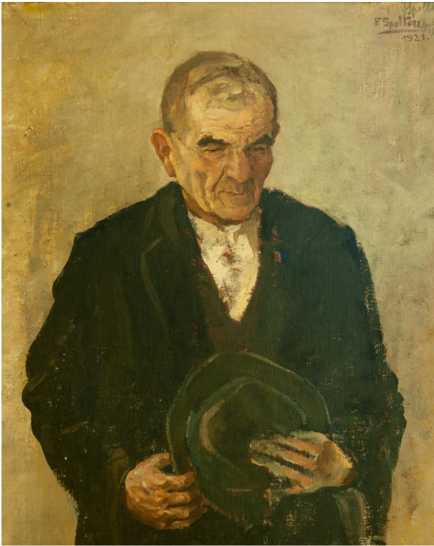
Fig. 1 - Federico SPOLTORE, Contadino abruzzese , 1921, Olio su tela, 80 x 65 cm. Chieti

Al di là della rappresentazione del vero, con una pennellata sciolta e veloce, fin dal principio emerge una caratteristica propria di Federico Spoltore, che sarà l'idea di fondo di tutto il suo operare. Un'idea che il Maestro mai tradirà e che lo accompagnerà con forme espressive diverse (anche molto diverse), fino alle ultime opere. Si tratta della capacità di osservare ed esprimere i sussulti interiori, i sentimenti più nascosti e le reazioni istintive alle sollecitazioni ricevute, legate al momento specifico, e chiaramente al carattere, di una persona. Questa caratteristica trova inizialmente spazio nella ritrattistica, di cui Federico fu maestro eccellente.