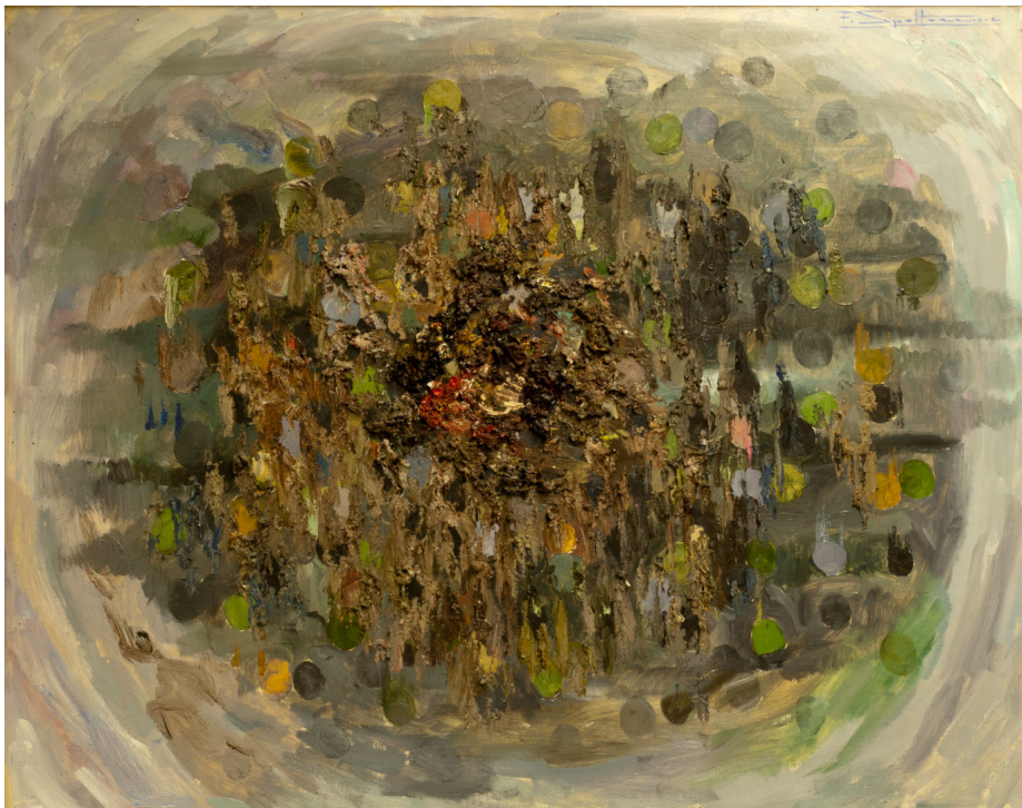
Fig. 8 - Federico SPOLTORE, Sfacelo , 1965, Olio su tela, 75 x 95 cm. Chieti, cortesia UBI Banca, ©Collezione UBI Banca

Interiorità - istinto - emozione - conoscenza. Sono le parole chiave di questo nuovo linguaggio, attraverso il quale rappresentare le emozioni correlate alle Stagioni (serie) o al Risveglio mattutino , avvenimenti dolorosi come la Morte del mio cane (il cane Tom è spesso soggetto delle opere figurative dell'autore), o ancora le riflessioni sulla guerra e la pace ( Il mondo della guerra , Il mondo della pace ) 37 .