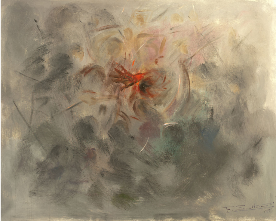
Fig. 6 - Federico SPOLTORE, Trauma Linciaggio , 2 di 3, 1965, Olio su tela, 80 x 100 cm. Chieti, cortesia UBI Banca, ©Collezione UBI Banca