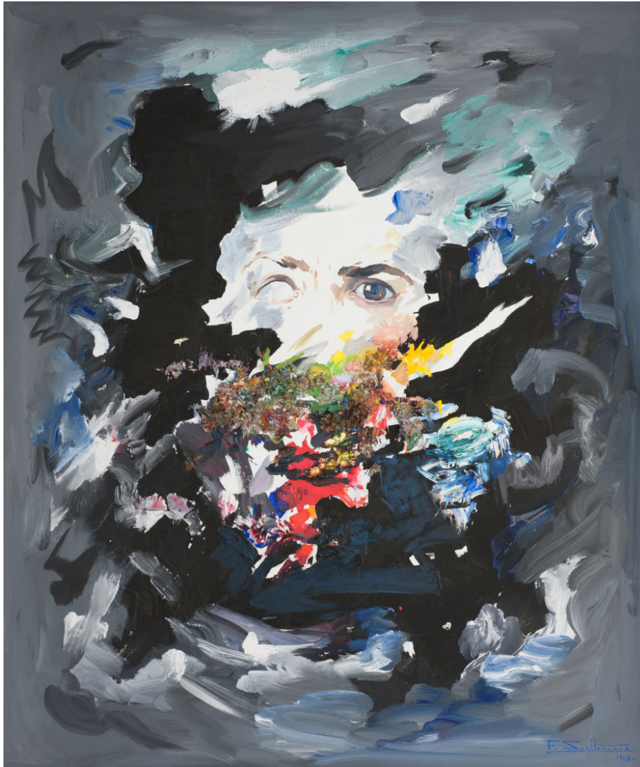
Fig. 3 - Federico SPOLTORE, Autoritratto , 1968, Olio e tecnica mista su tela, 125 x 100 cm. Chieti

Il confronto tra il Contadino abruzzese del 1921 (fig. 1) e le opere di un ventennio dopo, come Carolina (fig. 2) o Lo psicologo del 1948 17 , rende bene l'accentuarsi di interesse per gli aspetti psicologico-caratteriali e la gestualità, che accompagna la rappresentazione delle interiorità dei personaggi ritratti. Lo psicologo , col volto di tre quarti, l'occhio sinistro strizzato e il destro, in primissimo piano, spalancato e profondo, restituisce anche l'idea dell' occhio come specchio dell'anima , sulla quale Spoltore evidentemente rifletté a lungo, fino a giungere all'incredibile formulazione del proprio autoritratto centroemotivista (fig. 3).