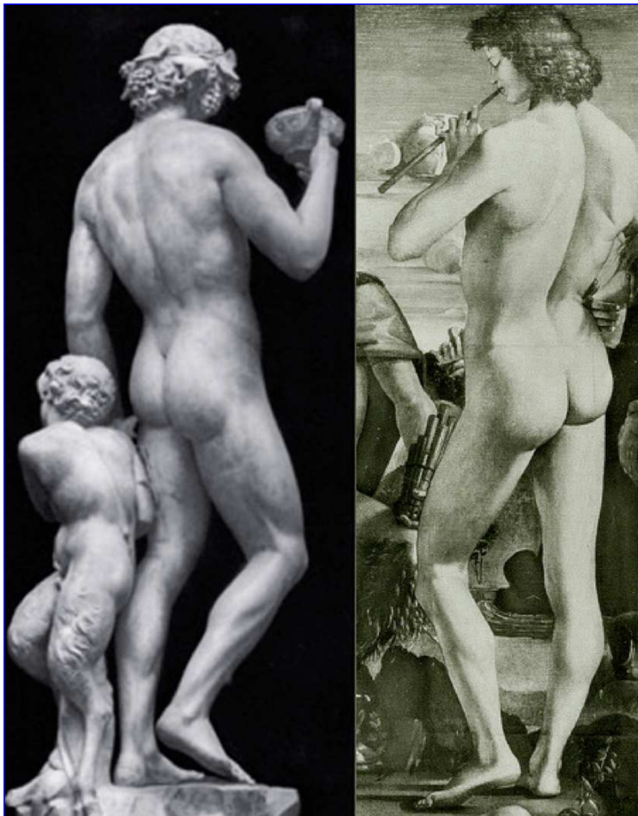
Fig. 5: Confronto visivo tra il Bacco di Michelangelo e un dettaglio dell' Educazione o Regno di Pan di Luca Signorelli.

In un contesto assimilabile ad un soggetto dionisiaco, la figura del musicista voltato di spalle mostra una stretta somiglianza con il Bacco michelangiolesco, nella corporatura e nella postura, compreso il piede sollevato dal suolo [fig. 5]. Si suppone di aver ritrovato, dunque, una dimostrazione visiva della proposta di riconoscere nella figura del Bacco un riferimento alla danza dionisiaca, in un analogo ambito musicale e quindi rituale. Nella realizzazione della scultura per Raffaele Riario, Michelangelo Buonarroti probabilmente aveva in mente la figura che Luca Signorelli aveva dipinto per i Medici, storici nemici della famiglia del cardinale.