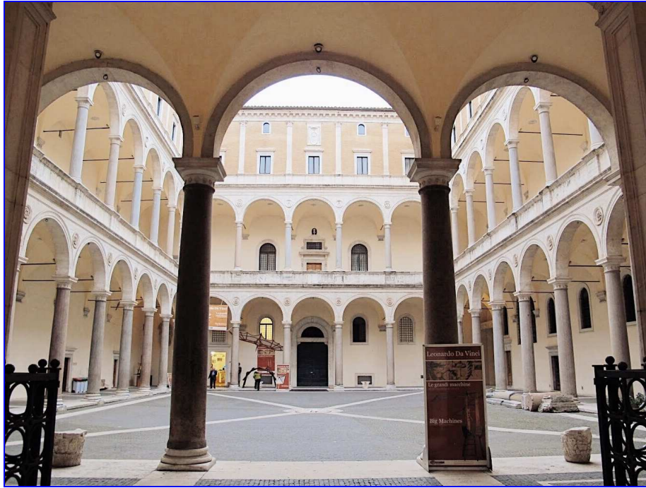
Fig. 2: Il cortile di Palazzo della Cancelleria visto dal portico d'ingresso, Wikimedia Commons.

In accordo con il progetto mecenatistico di Riario [72], l'evidente connessione tra il palazzo e il teatro trova una riprova nella probabile decorazione statuaria che continuava ad essere prevista per il portale secondo il progetto più tardo attribuito ad Antonio da Sangallo il Giovane [73] e che era in ogni caso già destinata ad arricchire l'arredamento dello spazio del cortile [74], elegante ma sobrio [75]. Le due statue colossali romane insieme alle quali il Bacco sarebbe stato esposto, infatti, la cosiddetta Melpomene [76] e Giunone , notate presso il palazzo da Albertini nel 1509-1510, dovevano forse essere collocate fin dall'inizio nel cortile [77]. La scultura michelangiolesca del Bacco sarebbe stata dunque integrata in una compagine figurativa ben pianificata e costituita da statue antiche [78] che alludevano alle arti dello spettacolo [79]. Permangono comunque ancora delle riserve sulla precisa disposizione del Bacco all'interno del cortile: si presume che la statua michelangiolesca fosse posta al centro del cortile in modo da precedere le gradinate mobili [80]; un'altra possibilità prevede tuttavia la collocazione laterale oppure l'inserimento tra le arcate centrali al pianterreno, che avrebbe reso dunque la statua disponibile all'occorrenza a diventare parte del fondale di una scena teatrale, onorando così le proposte archeologizzanti dei vitruviani [81].