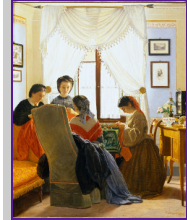
Fig. 4 Odoardo Borrani, Cucitrici di camicie rosse 1863, olio su tela, 66 x 45 cm, Collezione privata.