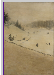
Fig. 7 Giuseppe De Nittis, Campo di neve 1880 ca., olio su