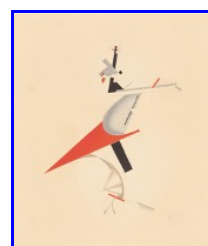
Fig. 3 Agitatore , portfolio di figurine per Vittoria sul sole, 1923 Stiftung Moritzburg, Kunstmuseum des Landes Sachsen-Anhalt, Halle, Folkwang Museum, Essen