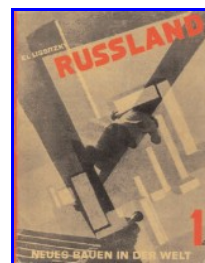
Fig. 4 Russland. Neues Bauen in der Welt I (Russia. Nuove costruzioni nel mondo I) , 1930 Fundación José María Castañé, Madrid