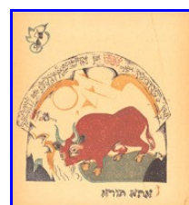
Fig. 1 Venne un toro , da Khad Gadya ( Una capretta ), Kiev, 1919 Stiftung Maritzburg, Kunstmuseum des Landes Sachsen-Anhalt, Halle

Dopo essere stato uno dei maggiori esponenti, insieme a Chagall, della rinascita della grafica libraria ebraica, El' Lissitzky (1890-1941), partendo dall'insegnamento di Malevič, raggiunge la perfetta sintesi costruttivista. Pittore, fotografo, tipografo, architetto ed inventore di rivoluzionari allestimenti per le esposizioni internazionali di propaganda, frequenta assiduamente Malevič alla Scuola d'arte di Vitebsk dove realizza una serie di manifesti di agitazione che vengono esposti davanti alle fabbriche. Iproun (progetti per l'affermazione del nuovo), realizzati sempre a Vitebsk, sono la chiave di volta del passaggio dal suprematismo piano al suprematismo tridimensionale: "Proun è la definizione che abbiamo dato ad una tappa verso l'edificazione della forma nuova". La figura astratta del proun navigante nello spazio si pone come principio unificatore