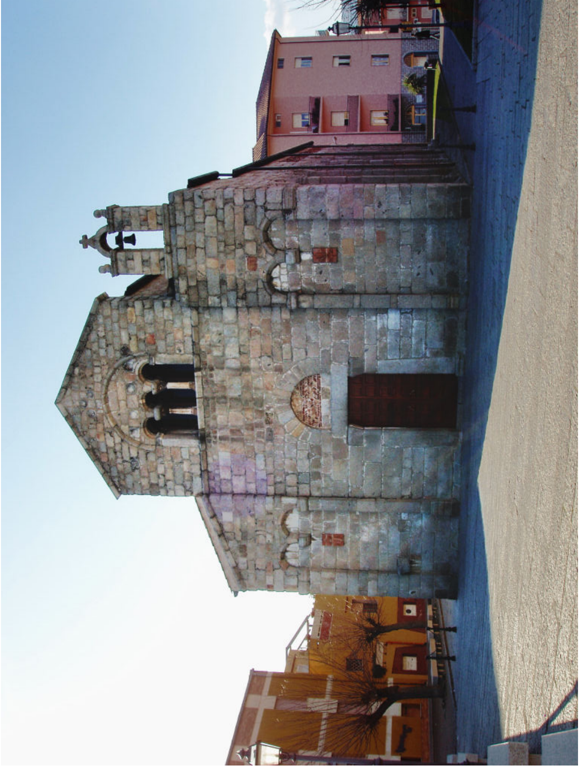
Fig. 2 Olbia, Basilica minore di San Simplicio, XI-XII secolo