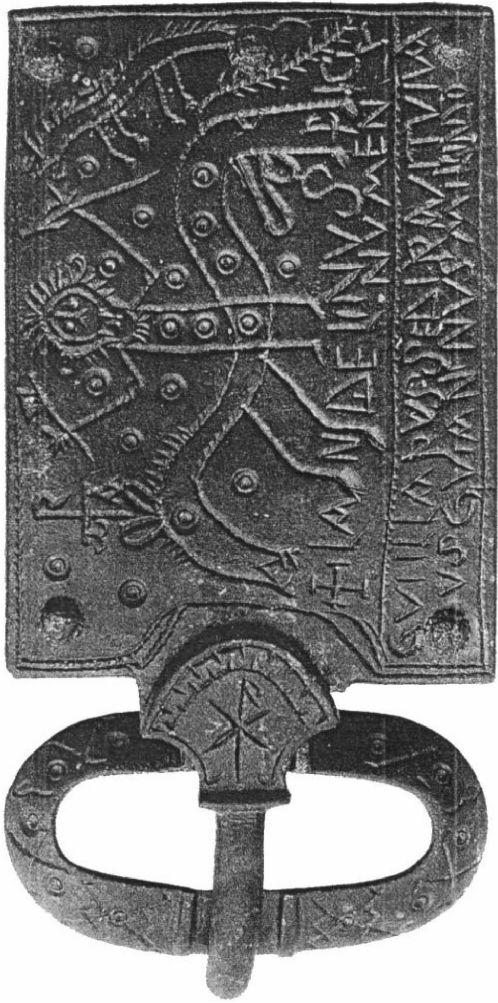
Fig. 3 LANDELINUS, Fibbia, primo quarto del sec. VII