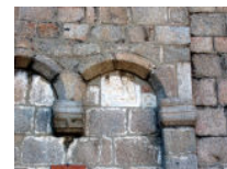
Fig. 4 Olbia, Basilica minore di San Simplicio, facciata, particolare, XI-XII secolo