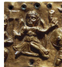
Fig. 7 Lamina di Agilulfo (591-616), particolare Firenze, Museo del Bargello