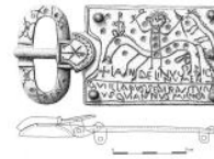
Fig. 5 Disegno della Fibbia di Landelinus, primo quarto del sec. VII

Un confronto puntuale invece è proponibile, come suggerì la Serra, con alcune fibbie del VII secolo, soprattutto merovingiche. Un riscontro si ha in particolare con la fibbia di Landelinus, ritrovata in una necropoli del VII secolo nel 1971 presso il villaggio di Ladoix-Serrigny, nella Côte D'Or francese vicino alla città di Beaune 11 . Nonostante il ritrovamento risalisse ai primi anni Settanta, solo nel 2003 la fibbia è stata studiata approfonditamente, soprattutto dal punto di vista iconografico, da Henri Gaillard de Sémainville 12 . Si tratta di una fibbia in bronzo inciso di 92-94 mm di larghezza e 67-68 mm di altezza appartenente al cosiddetto gruppo C, con una cronologia quindi corrispondente al VII secolo. Nella fibbia è rappresentato un cavaliere in sella al suo cavallo che con la destra tiene un'ascia e con la sinistra una lancia, mentre sulla destra in alto è rappresentato un altro quadrupede. Sulla sinistra del personaggio è rappresentato il Crismon con lettere apocalittiche, mentre in basso appare, dopo una croce patente, la scritta: