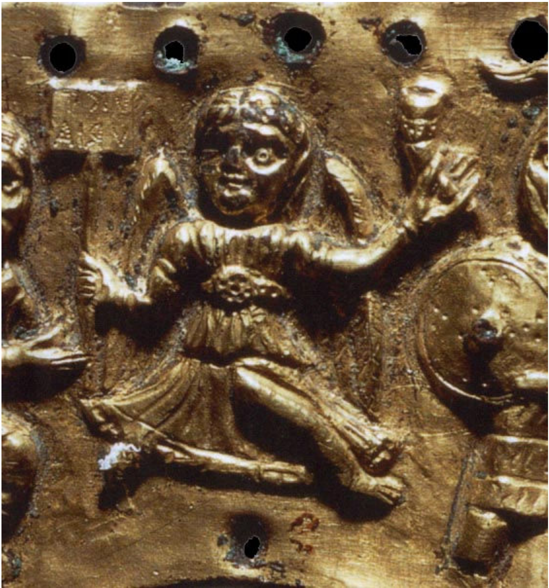
Fig. 7 Lamina di Agilulfo (591-616), particolare, Firenze, Museo del Bargello