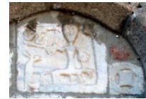
Fig. 1 ANONIMO, Sconfitta dei popoli pagani , bassorilievo in marmo (600 ca.); Rosetta, marmo (sec. VIII), Olbia, San Simplicio