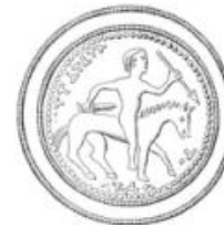
Fig. 6 Disegno della Placca d'oro di Hove (Norvegia), prima metà del sec. VII