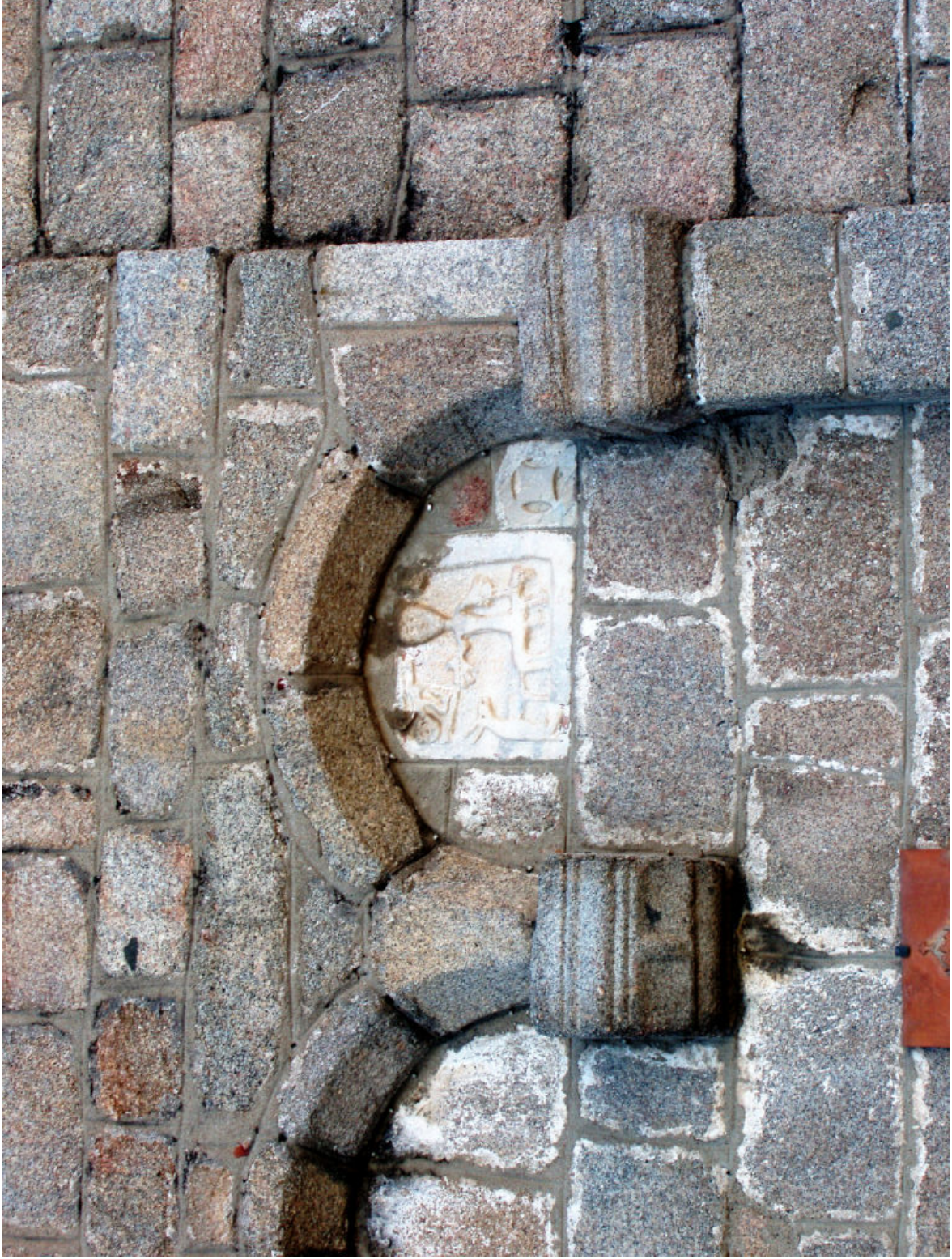
Fig. 4 Olbia, Basilica minore di San Simplicio, facciata, particolare, XI-XII secolo