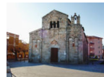
Fig. 2 Olbia, Basilica minore di San Simplicio, XI-XII secolo