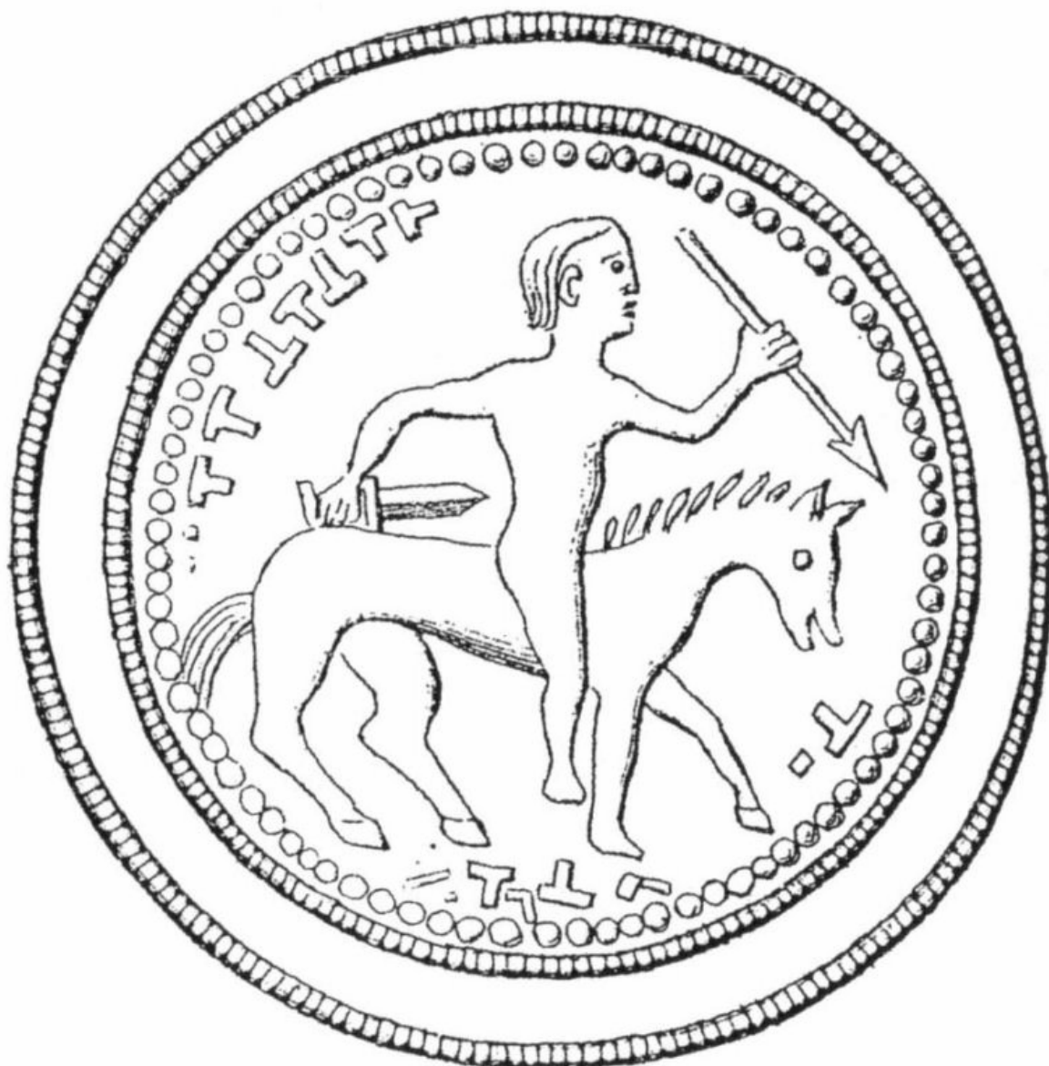
Fig. 6 Disegno della Placca d'oro di Hove (Norvegia), prima metà del sec. VII