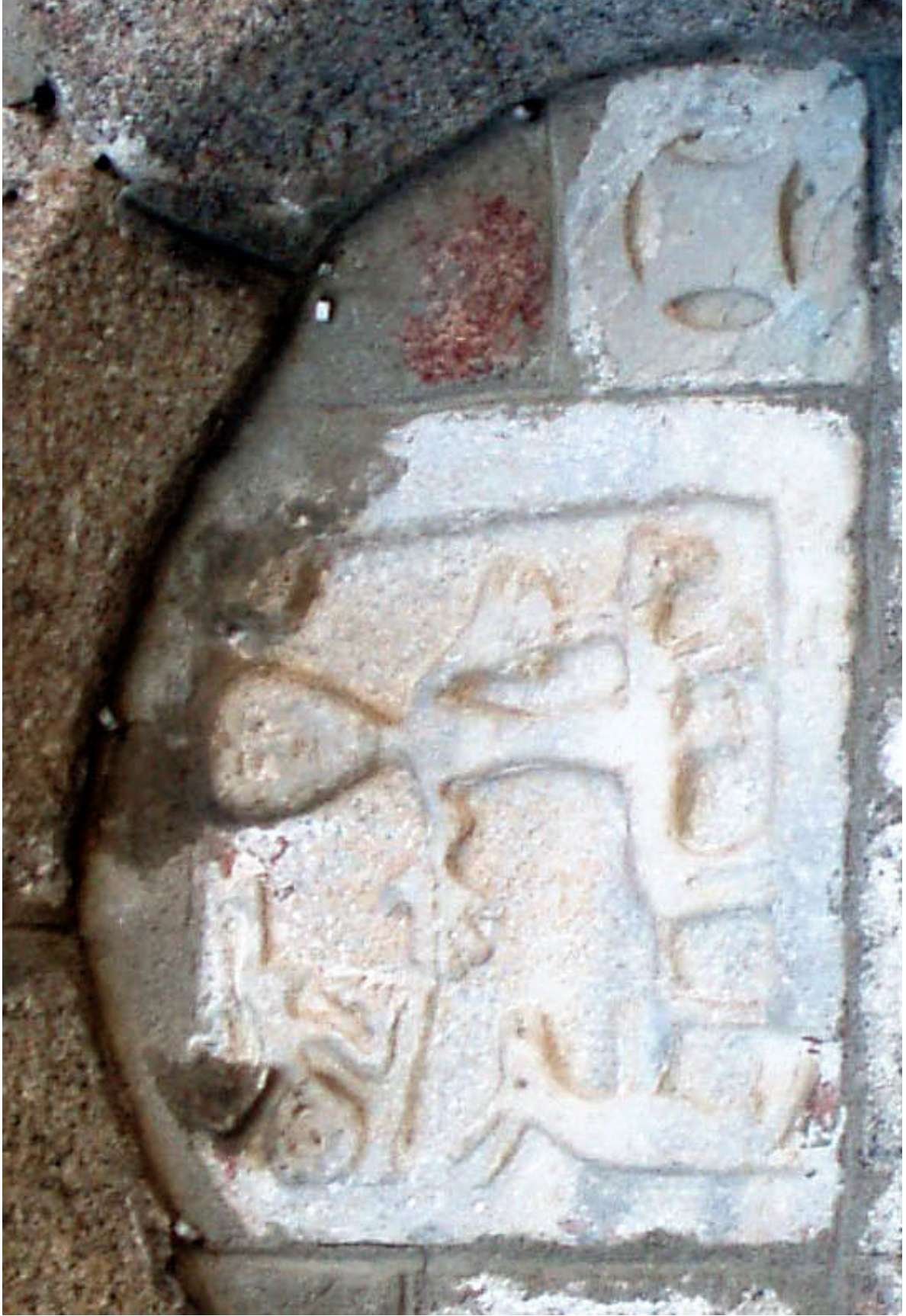
Fig. 1 ANONIMO, Sconfitta dei popoli pagani , bassorilievo in marmo (600 ca.); Rosetta, marmo (sec. VIII), Olbia, San Simeone BTA - pagina 6 di 12